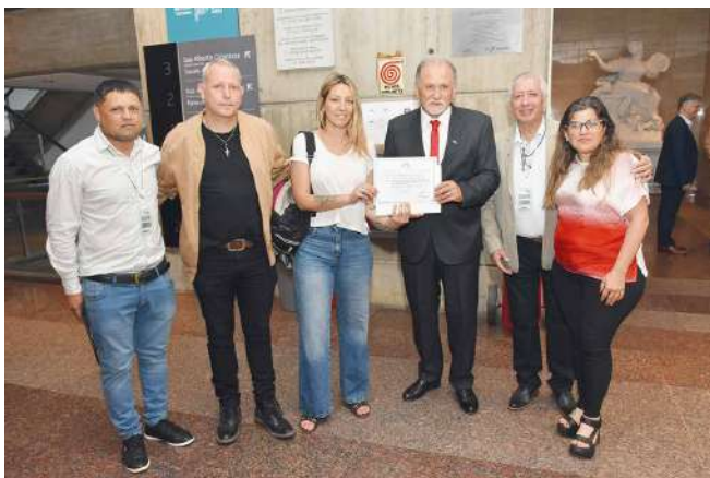
El Congreso fue declarado de interés municipal por el Consejo Deliberante platense.

En la ceremonia de apertura desarrollada en el salón Astor Piazzolla del Teatro Argentino de La Plata hubo