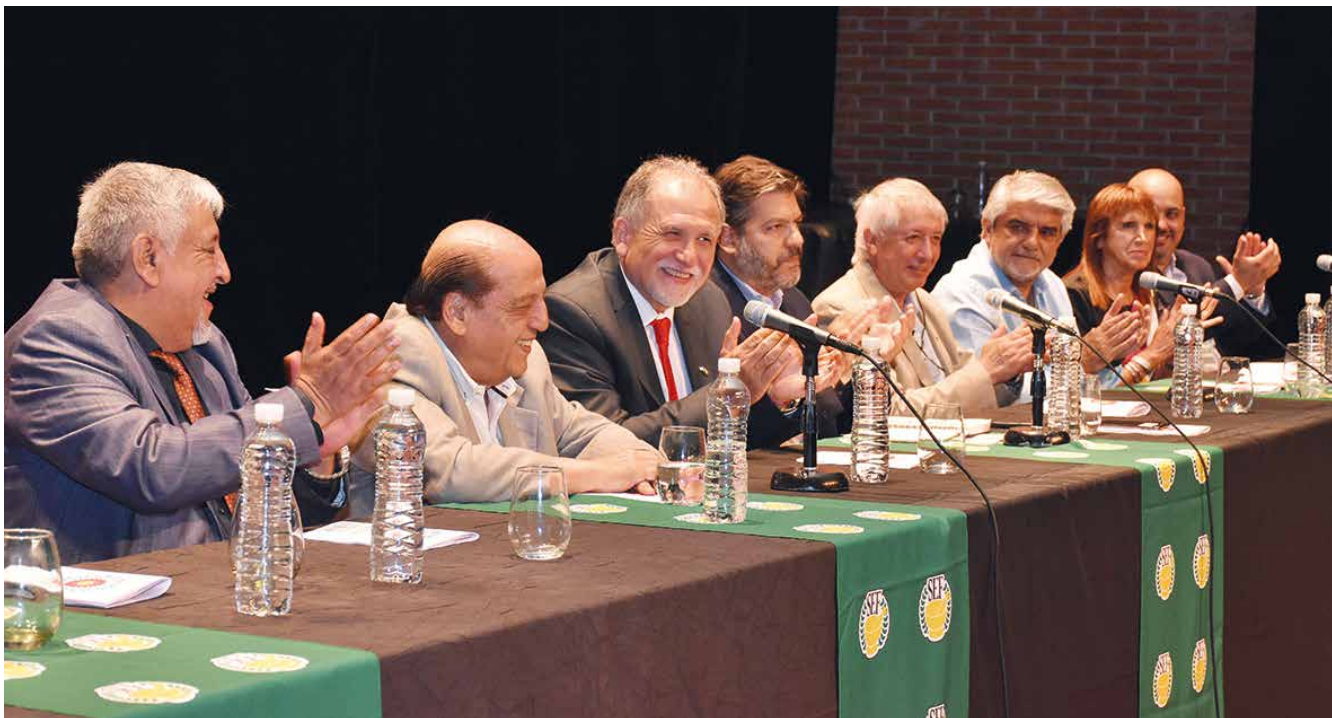
El acto inaugural contó con la presencia de funcionarios provinciales, municipales y dirigentes sindicales.